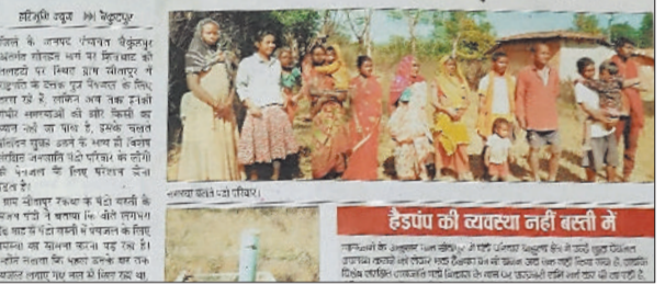
हरिभूमि में प्रकाशित खबर।

की प्रक्रिया में है। इसके पश्चात ग्राम में नियमित जल आपूर्ति बहाल होने की उम्मीद है। फिलहाल ग्रामीणों को पेयजल की समस्या से राहत देने के लिए पूर्व से स्थापित हैंडपंपों को सबमर्सिबल पंप लगाकर सिंगल सिस्टम लाइन के माध्यम से