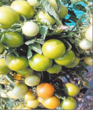
टमाटर एवं सेम की फसल।