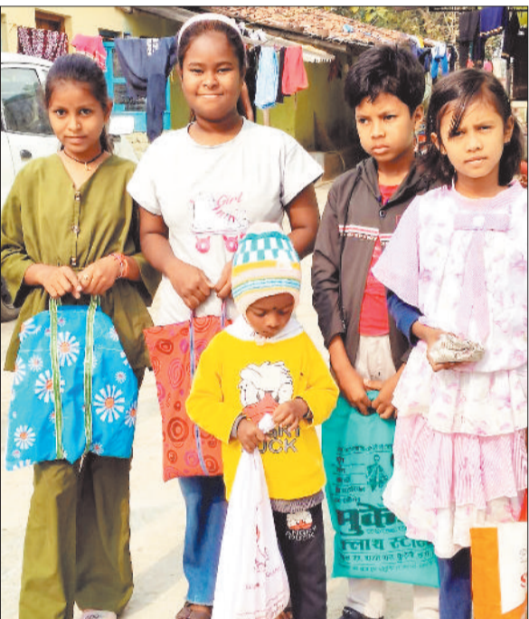
हरिभूमि न्यूज | बैकुंठपुर

प्रदेश का पारंपरिक व अनन्दान का महापर्व छेरछेरा जिले के ग्रामीण अंचल में लोगों के द्वारा समरसता व उल्लास के साथ मनाया जाएगा। मान्यता है कि छेरछेरा के दिन अन्न का दान करने से घर में सालभर सुख-समृद्धि और धन्य धान्य की कमी नहीं होती। यही कारण है कि छेरछेरा पर्व के दिन घर के दहलीज पर याचक को अनाज जरूर दान किया जाता है।